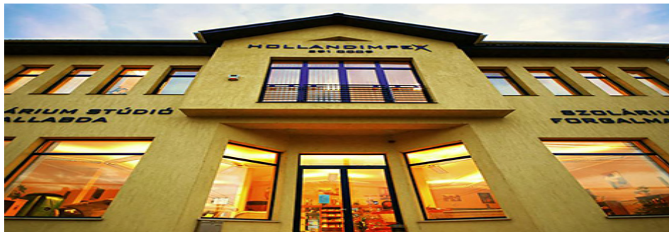
A feltüntetett adatok tájékoztató jellegűek a változtatás jogát fenntartjuk!